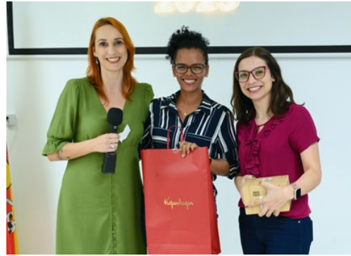
Convidada foi sorteada pela AEAS após evento