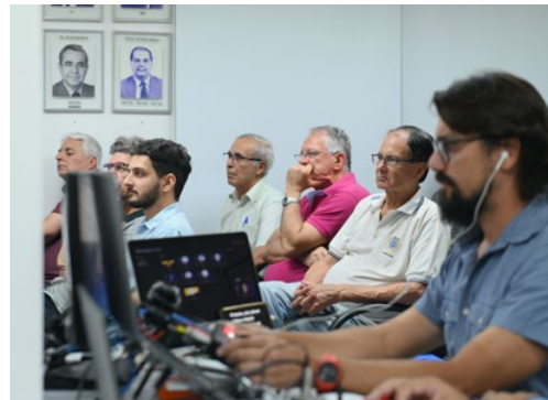
Palestra é lecionada durante evento