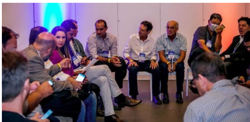
Participantes da primeira reunião do ano do CDER-SP

A Associação dos Engenheiros e Arquitetos de Sorocaba (AEAS) esteve presente por fazer parte de um desses dez grupos, com o tema Inovação e Tecnologia, o que demonstra seu total interesse em auxiliar no desenvolvimento tecnológico e inovador da sociedade por meio da engenharia e da arquitetura.