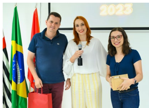
Convidado ganha sorteio oferecido pela AEAS