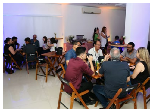
Happy Hour promovido pela AEAS no último dia do Kick Off