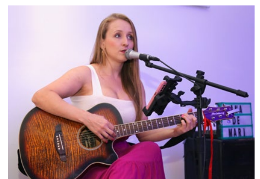
Cantora convidada para o Happy Hour