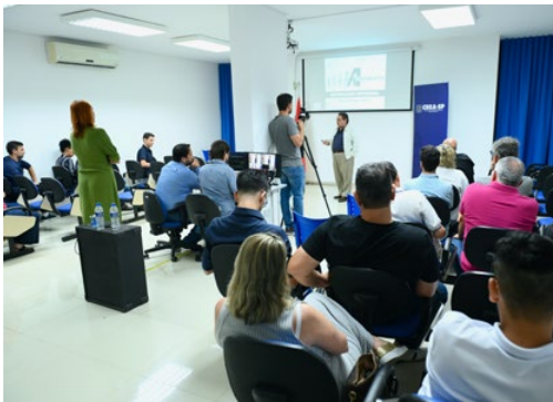
O evento promoveu uma série de palestras