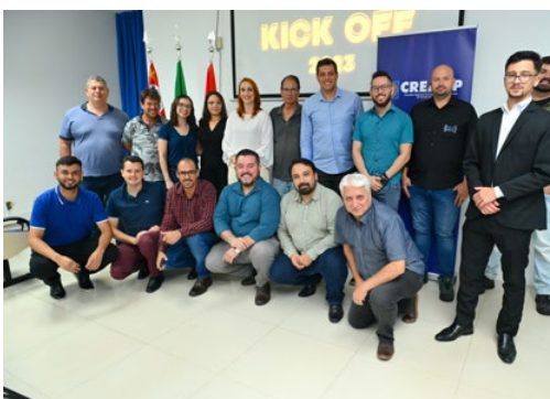
Participantes do Kick Off AEAS 2023