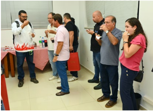
Participantes prestigiam o coffee break oferecido